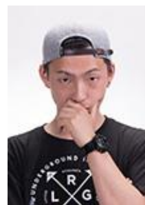
DAICHI (YUTTY KINGDOM)