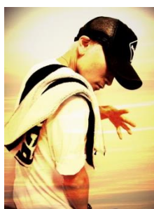
TMY (Who is Respected!?)